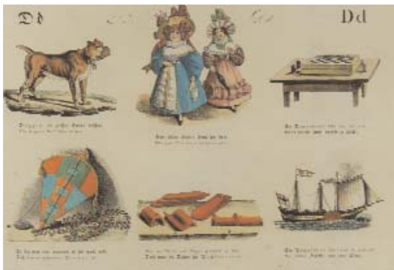
7 Deutsches ABC