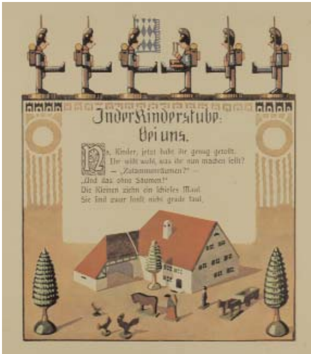
136 Fritz Kracher

138 - . Theophron oder der erfahrene Rathgeber für die unerfahrene Jugend. Ein Vermächtnis für seine gewesenen Pflegesöhne und für alle erwachsene (2: erwachsene) junge Leute welche Gebrauch davon machen wollen. 2 Tle. in 1 Bd. Tübingen, Schramm und Balz, 1786. 4 unnum., VII Bll., 216; 160 S., mit gest. Frontispiz von (C.G. Müller nach E.S. Henne). HLdr.d.Zt. mit RSch. 280,-